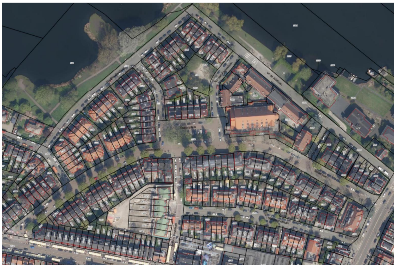
Luchtfoto van het Statenlaankwartier in de lente, met ingetekende kadastergrenzen. De huidige bomen en parkeerplekken en het speelveldje bij de Tarcisius school zijn goed te zien.