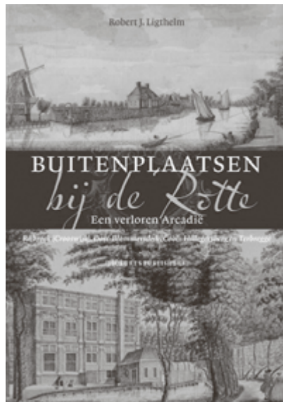
Cover van het boek, te koop bij boekhandel Maximus in de Bergse Dorpsstraat.