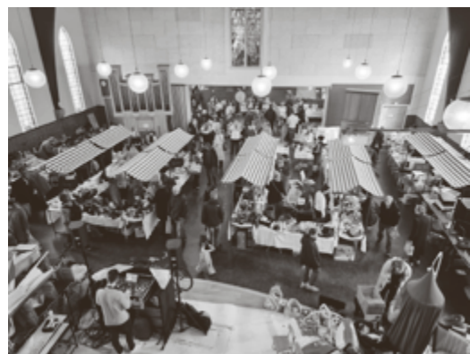
Impressie van de bazaar editie 2024