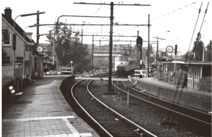
Oude situatie station Kleiweg