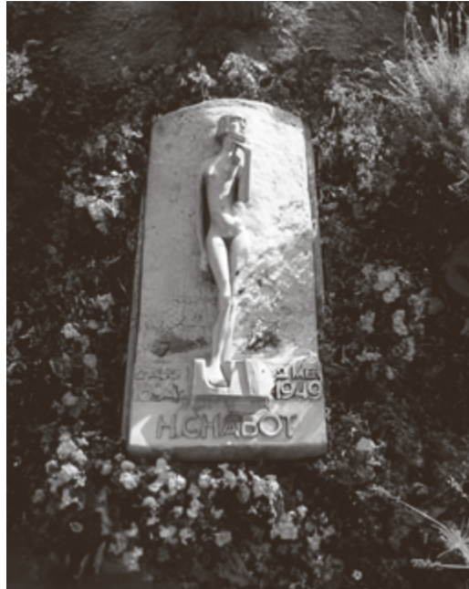
Grafmonument van Hendrik Chabot

glas-in-loodramen van de Hillegondakerk. De lezing begint om 10.00 uur en duurt tot 12.00 uur, de inloop is vanaf 9.30 uur. Het adres van de Fonteinkerk is Terbregselaan 3, Rotterdam.