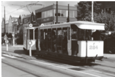
De zomertram met open aanhanger (bouwjaar 1907) slaat af naar de Hillegondastraat.

Het hoogtepunt was op die zaterdag 29 juli het herleven van de oude tramlijn 14. Maar liefst zeven verschillende tramtypen uit de grote collectie die in de museumremise is ondergebracht reden als lijn 14 tussen de Molenlaan en Kralingen. De route was niet helemaal historisch verantwoord, maar omdat het centrum van Rotterdam onbereikbaar was wegens het Zomercarnaval werd uitgeweken naar