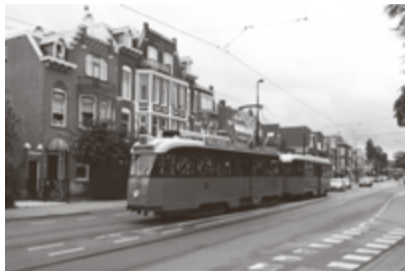
Het Allan tramstel uit 1950 op de Straatweg.

de Burgemeester Oudlaan. Daarbij werd toevallig voor een groot deel gereden over tramrails die volgens het MRDH-plan 'Toekomstvast Tramnet' overbodig zijn en over enkele jaren zullen worden opgebroken.