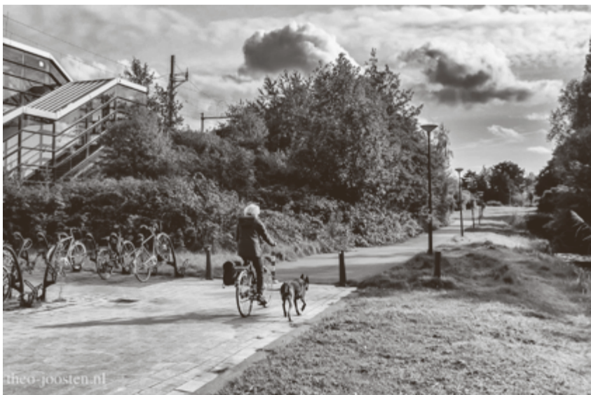
Humanistenpad in 2022.