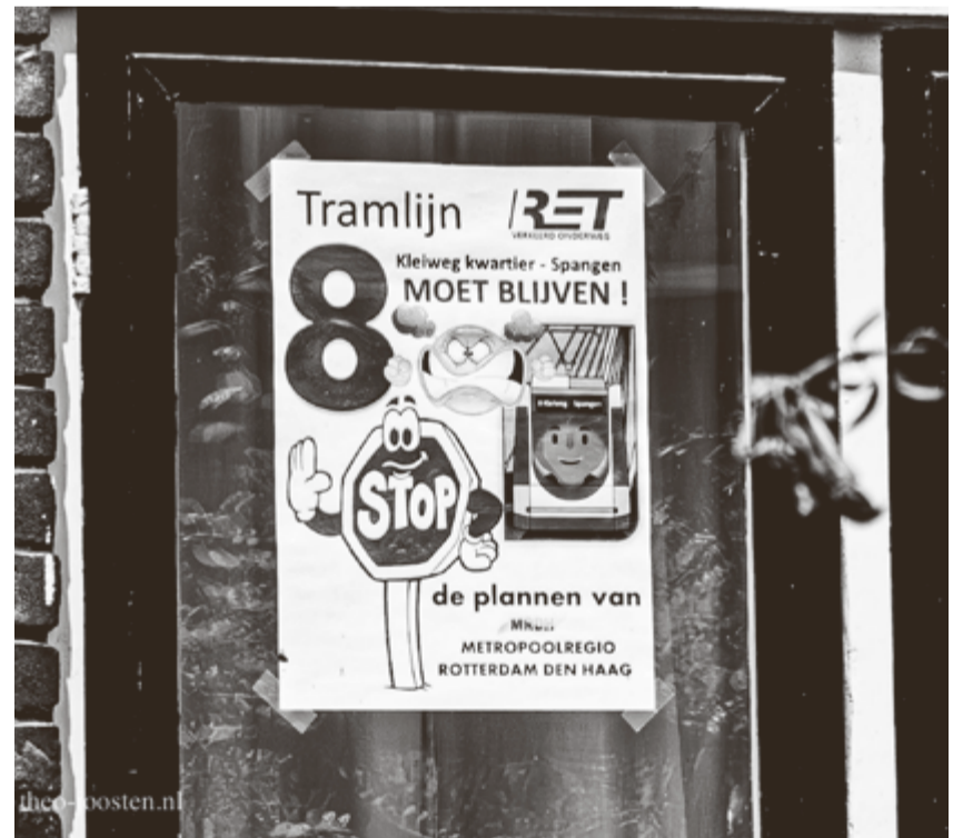
Affiche op de Schiebroekseweg

bij de reizigersaantallen passende frequentie.' En over het vervolg: 'De uitvoering van het toekomstplan voor de tram start in 2024 en zal in 2030 voltooid zijn.' Wordt vervolgd.