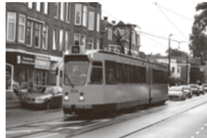
De jongste museumtram (uit 1985) op de Straatweg.