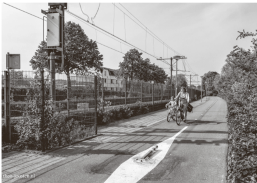
Allanpad in 2020.

In verband hiermee verzoeken wij u zich vooraf aan te melden op e-mail kritih31@outlook.com .