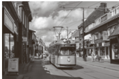
Düwag tram 385 uit 1965 in de Bergse Dorpsstraat.