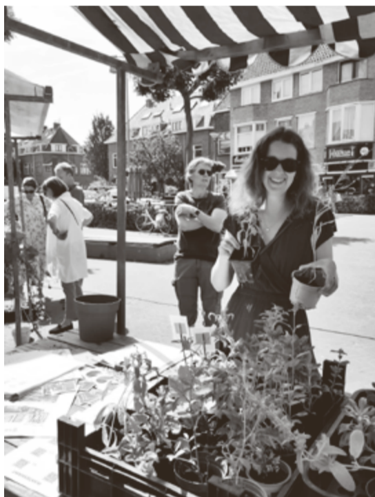
Plantjesmarkt in juni.

En ook degene die ons team wil komen versterken is van harte welkom.