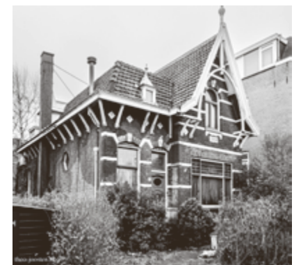
Straatweg 8

Het is uiteindelijk het College van B&W dat beslist over de aanwijzing van een pand tot gemeentelijk monument.