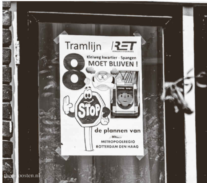
Affiche op de Schiebroekseweg

Het sentiment dat Penning had aangeboord, bleef niet zonder gevolgen. De VVD lijkt zich niet meer op de borst te kloppen dat de tram in Hillegersberg is gered en coalitiepartner DENK begon recent ook terug te krabbelen, maar