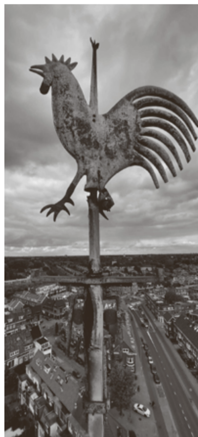
Het verwerde haantje van de toren van de Oranjekerk.