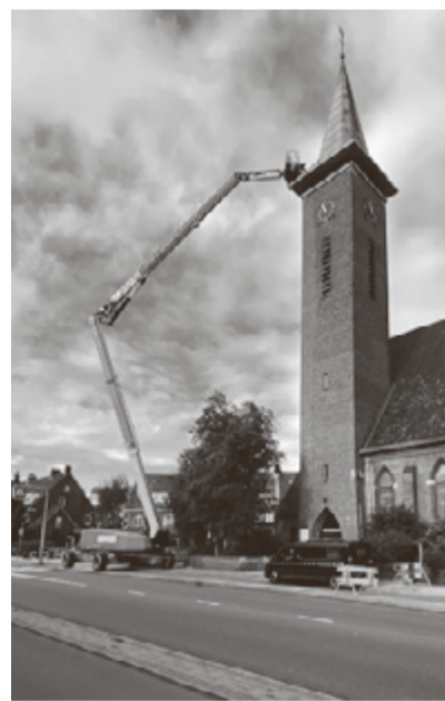
Herstel van de torenspits met een hoogwerker.

Begin februari heeft een storm de torenspits van de Oranjekerk behoorlijk beschadigd. Een deel van de koperen dakbedekking is daarbij losgeraakt en naar beneden gevallen.