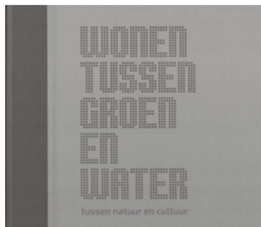
Cover van het boek.

Het boek kent een scala van onderwerpen waarvan een deel niet tot het traditionele werkterrein van de VSW (bescherming van monumenten) behoren. Zelf vond ik bijvoorbeeld de pagina over Volkstuinen en Buurttuinen interessant. Want wie weet er nou welke vier volkstuinverenigingen er in Hillegersberg-Schiebroek zijn gevestigd. Andere stukken gaan over de ontwikkeling van het openbaar vervoer, de opmars van de auto, de geschiedenis van het veenlandschap. De nieuwe tijd is vertegenwoordigd met stukken over nieuwe energie, klimaatadaptatie