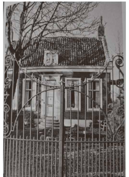
Het pand Straatweg 79 met en zonder het karakteristieke smeedijzeren hek.