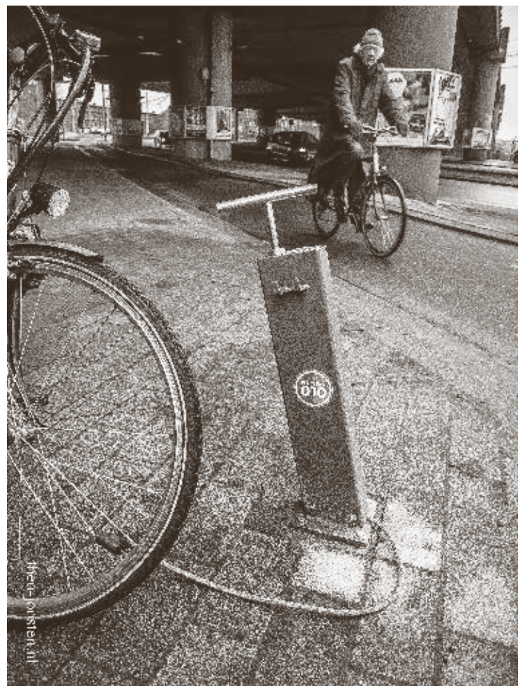
Net buiten het Kleiwegkwartier heeft de gemeente een openbare fietspomp geplaatst. Hij staat net ver van de nieuwe locatie van café 't Viaduct bij Station Noord, opgang treinen richting Gouda.