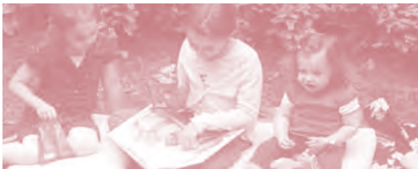
Tijdens de Landelijke Voorleesweek gingen buurtkinderen door de Azaleastraat/Cliviastraat met elkaar "op berenjacht" (Wij gaan op berenjacht/Helen Oxenbury). En daarna bleven zij elkaar voorlezen, de hele middag door!